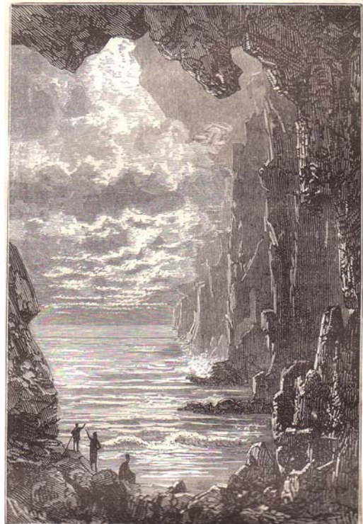
Zwei Beispiele Vernescher Hohlwelt-Phantasien: »Schwarz-Indien« (links) und »Die Reise zum Mittelpunkt der Erde« (rechts)

In der »Reise nach dem Mittelpunkt der Erde« hat Verne einige aktuelle Themen verarbeitet: die Höhlenforschung (ein Thema, das ihn mehrfach beschäftigte, z. B. in »Schwarz-Indien«, »Der grüne Strahl«, »Die Erfindung des Verderbens«, auch als »Vor der Flagge des Vaterlands« erschienen), das Leben in der Urwelt, die Geologie des Erdkörpers, insbesondere der Streit um das Zentralfeuer. Verpackt sind diese Informationen und Spekulationen in eine spannende Handlung: Von Hamburg reisen Professor Lidenbrock und sein Neffe Axel über Dänemark nach Island, steigen mit Hans, einem isländischen Führer, in den Sneffels Yökull, einen erloschenen Vulkan, ein, gelangen durch